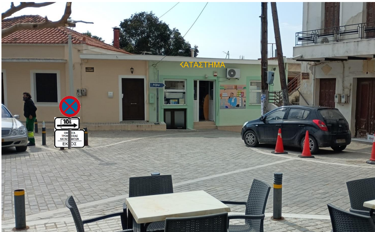
ΠΡΟΤΕΙΝΟΜΕΝΗ ΘΕΣΗ 1 (Σ1)