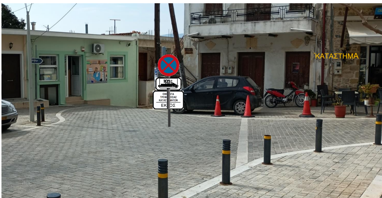
ΠΡΟΤΕΙΝΟΜΕΝΗ ΘΕΣΗ 2 (Σ2)