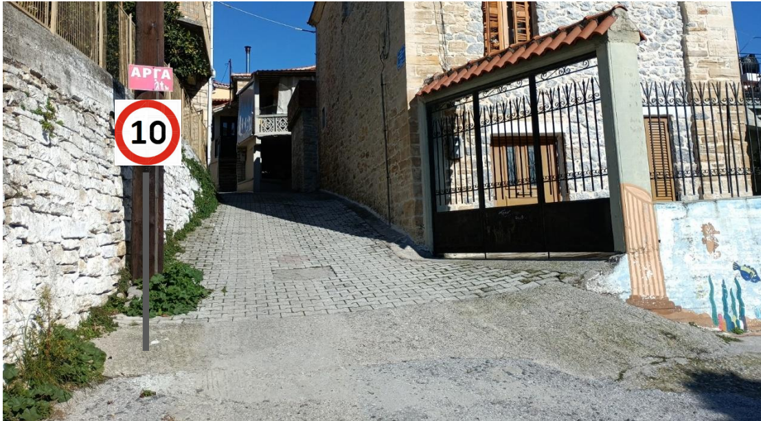
ΠΡΟΤΕΙΝΟΜΕΝΗ ΘΕΣΗ 1 (Σ1)