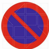
Ρυθμιστική πινακίδα Ρ-39 Απαγορεύεται η στάθμευση (μεσαίου μεγέθους Φ 45 εκ.)