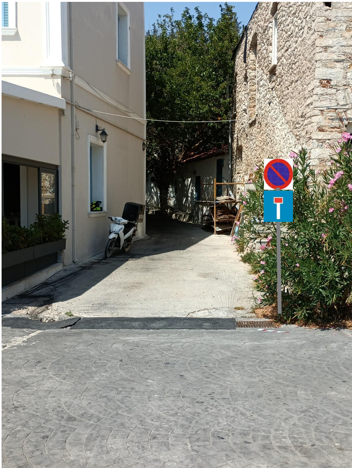
ΕΙΚΟΝΑ ΓΙΑ ΤΗΝ ΘΕΣΗ ΝΕΑΣ ΚΑΘΕΤΗΣ ΣΗΜΑΝΣΗΣ