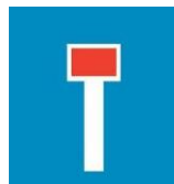
Πληροφοριακή πινακίδα σήμανσης Π25 Οδός αδιέξοδη (μεσαίου μεγέθους 45X45 εκ.)