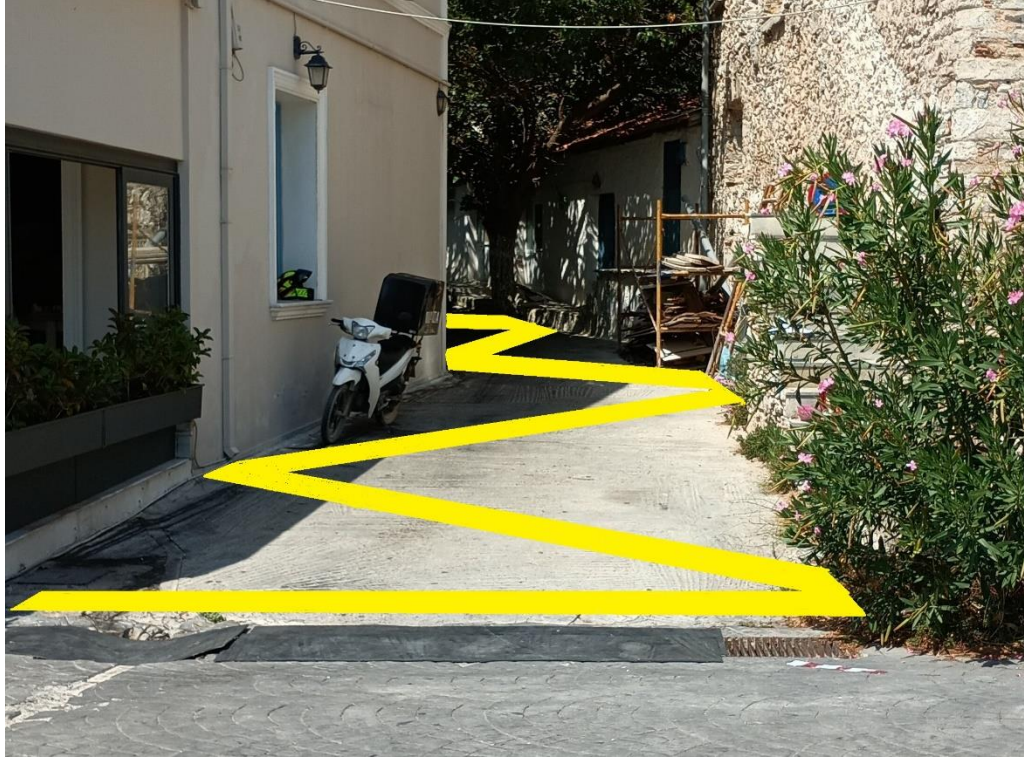
ΕΙΚΟΝΑ ΝΕΑΣ ΟΡΙΖΟΝΤΙΑΣ ΔΙΑΓΡΑΜΜΙΣΗΣ (ΑΠΑΓΟΡΕΥΣΗΣ ΣΤΑΣΗΣ)