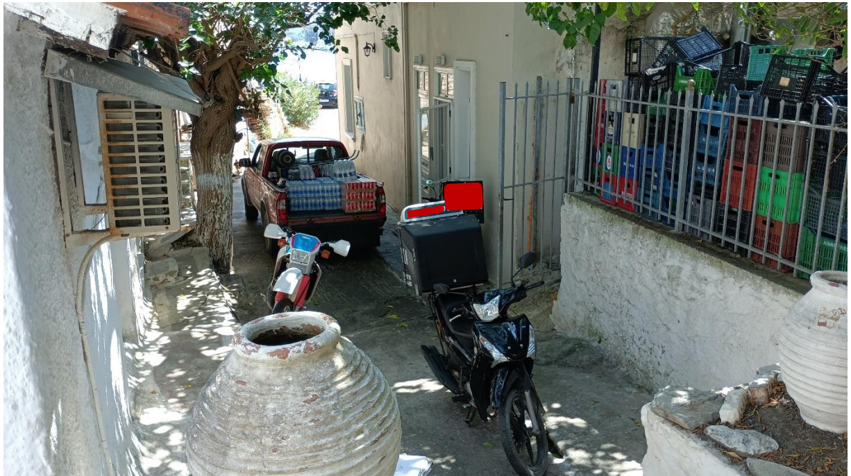
ΕΙΚΟΝΑ ΑΠΟ ΤΟ ΤΕΛΟΣ ΤΟΥ ΑΔΙΕΞΟΔΟΥ ΔΡΟΜΟΥ