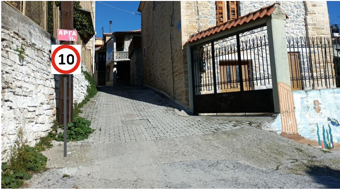
ΠΡΟΤΕΙΝΟΜΕΝΗ ΘΕΣΗ 1 (Σ1)