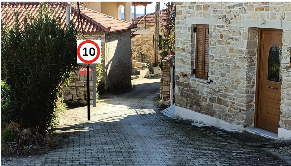
ΠΡΟΤΕΙΝΟΜΕΝΗ ΘΕΣΗ 2 (Σ1)