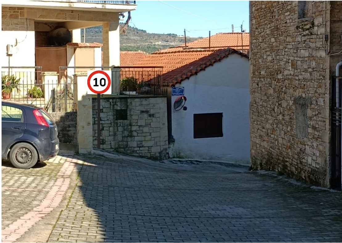
ΠΡΟΤΕΙΝΟΜΕΝΗ ΘΕΣΗ 3 (Σ1)