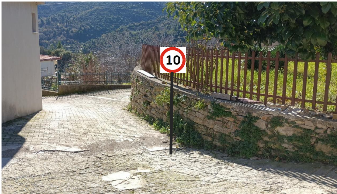
ΠΡΟΤΕΙΝΟΜΕΝΗ ΘΕΣΗ 4 (Σ1)