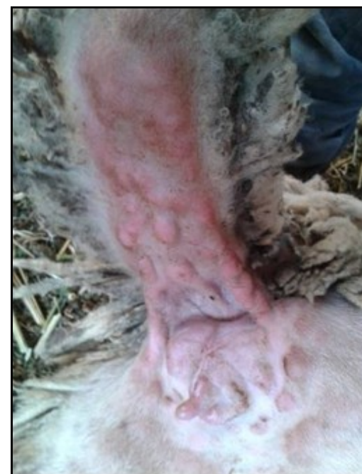
Χαρακτηριστικές αλλοιώσεις ευλογιάς στη βάση της ουράς. Κόκκινα σπυριά (βλατίδες).