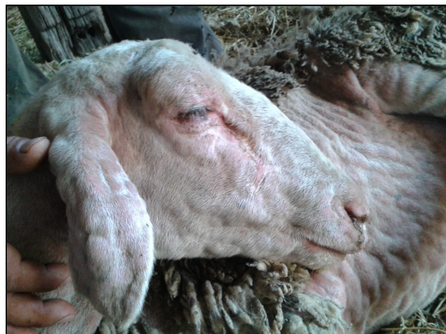
Πρόβατο με εκτεταμένες αλλοιώσεις ευλογιάς στο κεφάλι, το πρόσωπο και την κοιλιά. Κόκκινα σπυριά (βλατίδες).

2 Ψάχνουμε προσεκτικά για : Κοκκινίλες, Κόκκινα Σπυριά, Μαύρα κάπαλα, Πληγές, Μύξες, Δάκρυα