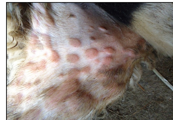
Τυπικές αλλοιώσεις ευλογιάς. Κόκκινα σπυριά (βλατίδες).